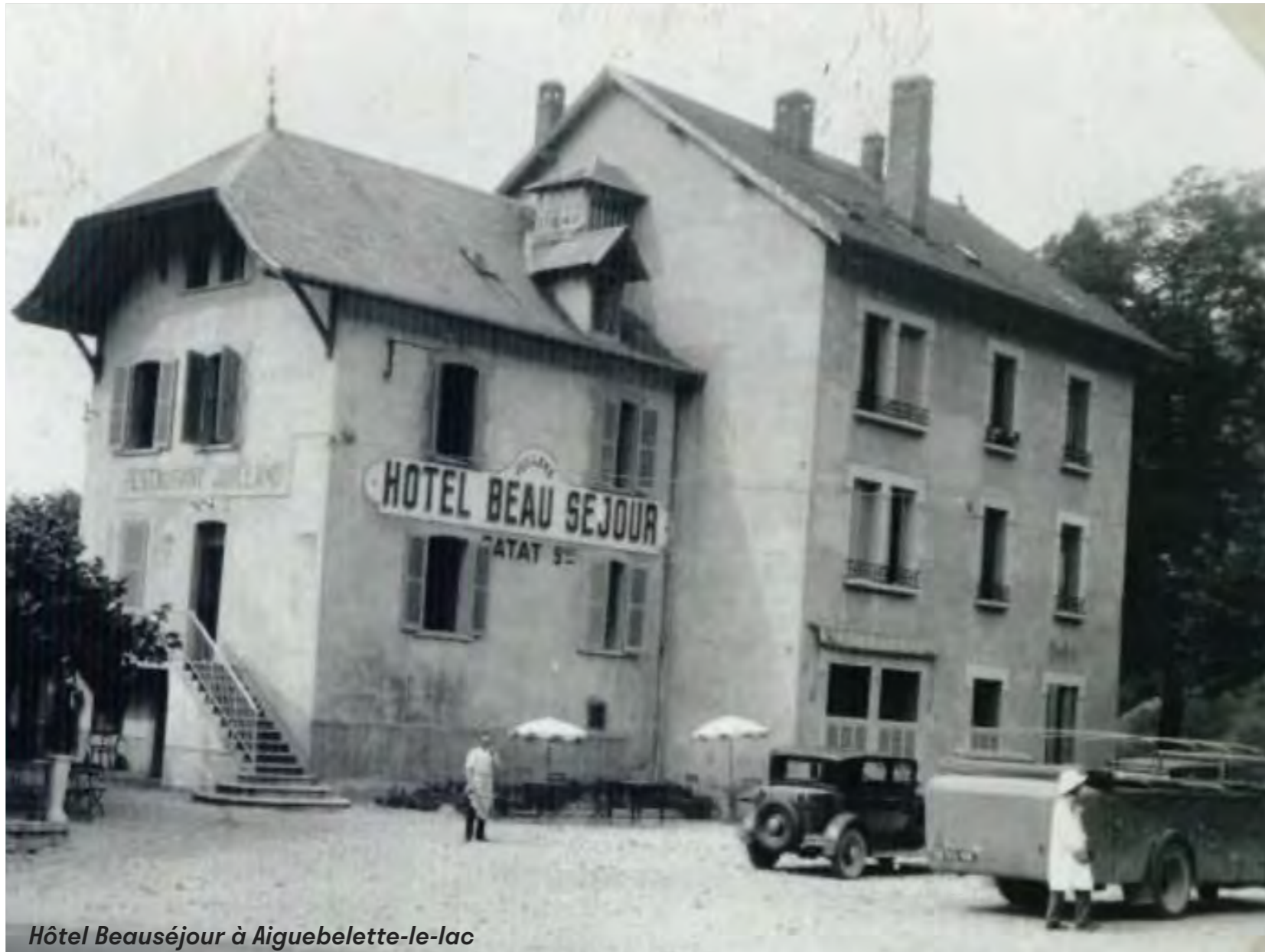
Hôtel Beauséjour à Aiguebelette-le-lac