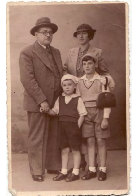
Famille Arom