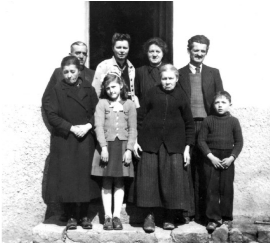
Les enfants Lewkowicz et le couple Guicherd

Jacques ont mené une vie de petits paysans dullinois pendant 3 ans, fréquentant l'école, l'église et les enfants du village sans jamais être inquiétés.