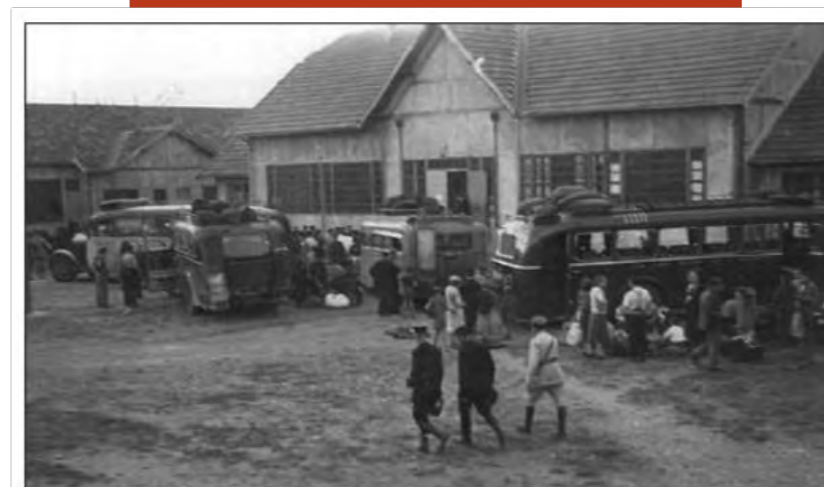
27 août 1942. Arrivée à Vénissieux des cars de Juifs étrangers raflés.

Simha Arom monte au petit jour dans un train en gare d'Aiguebelette-le-lac et part retrouver son frère dans la maison d'enfant de Moissac.